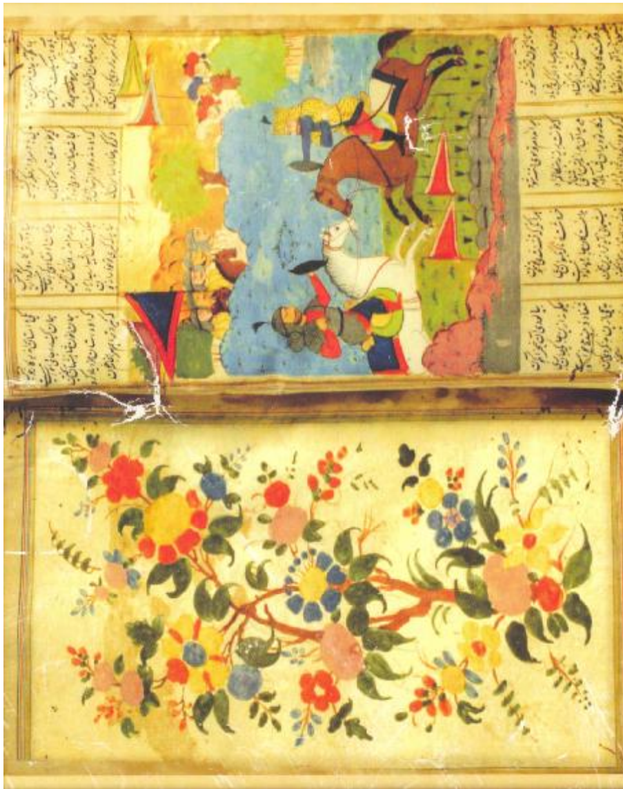
عکس شایسته شماره ۸۱۶ در کتابخانه مرکزی دانشگاه هندوی بنارس

نخستین که نوک قلم شد سیاه گرفت آفرین بر خداوند ماه